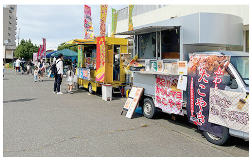
◎イベントイメージに適した例