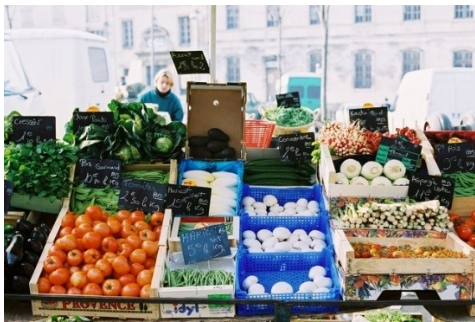
【イベントイメージに適した例】

「いわくら de マルシェ」では、お客様と出店者様のお互いが楽しめ、満足いただけるような「笑顔」があふれるイベントを目指しています。 よって、主催者では以下に記載されているイラストや写真のようなディスプレイで出店いただける申込者様を 優先しています 。